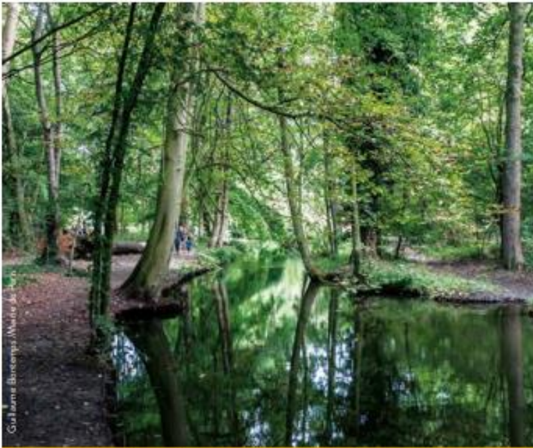
Les bois parisiens : de grands espaces de transition et d'adaptation pour la faune et la flore en marche vers le cœur d'agglomération comme ici au bois de Vincennes.

Le territoire parisien est riche de deux bois d'intérêt régional et de quatorze réservoirs fonctionnels de biodiversité . Ces espaces abritent des habitats variés et permettent aux espèces de trouver refuge, de s'alimenter et de se reproduire. Ils sont à préserver et à renforcer sur l'ensemble du territoire.