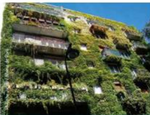
Toitures et façades végétalisées : des continuités écologiques dans la ville pour la biodiversité et l'adaptation au changement climatique.