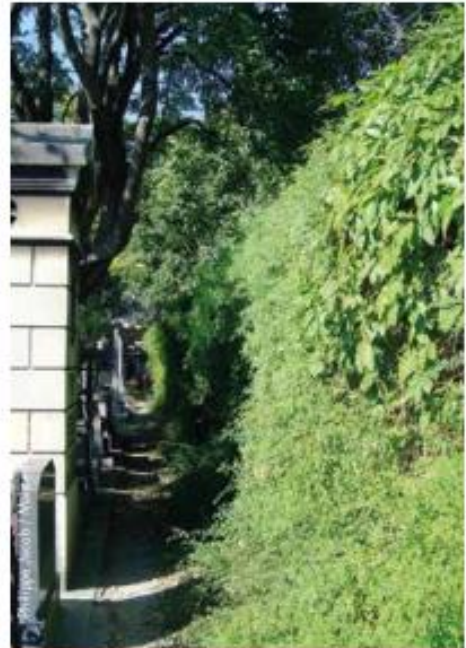
Les cimetières parisiens : des réservoirs de biodiversité insoupçonnés, comme ici le cimetière du Père-Lachaise, plus vaste espace de nature dans Paris.

Reliant entre eux ces espaces, les corridors écologiques favorisent la circulation des espèces et permettent la recolonisation des milieux. À Paris ils prennent des formes diverses : Seine, canaux et leurs berges, alignements d'arbres des rues, Forêt linéaire , Petite ceinture , ainsi que toute une mosaïque d'espaces végétalisés et d'habitats diversifiés connectés entre eux.