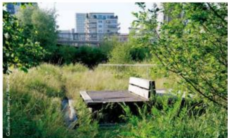
Les nouveaux espaces verts : conçus et gérés pour favoriser les continuités écologiques et la biodiversité comme ici au jardin Abbé-Pierre Grands-Moulins.