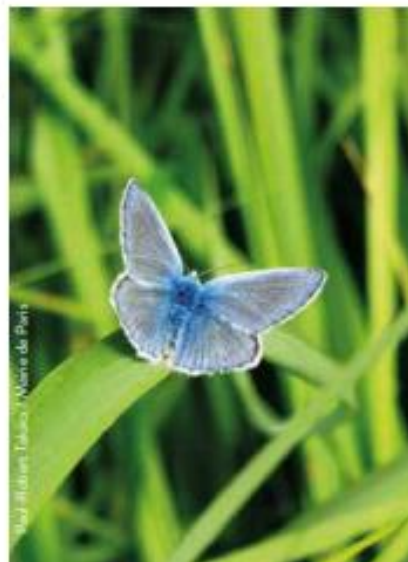
Le suivi de la faune et de la flore : des démarches de sciences participatives ouvertes à tous.

Pour en savoir plus : paris.fr/biodiversite